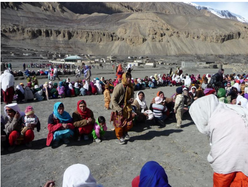
Thagham-Fest am 01.04.10 in Shimshal