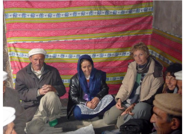
Grundsteinlegung mit anschließender Feier zum Abschluss einer schönen Zeit in Shimshal

Auf dem Rückweg haben wir den angestauten See per Boot bei schlechtem Wetter gequert und den Damm überschritten. Jeder Schritt fühlt sich an wie auf einem Wasserbett, es ist unheimlich. Zum Aufwärmen nach den kalten Tagen in Shimshal konnten wir bei herrlichem Sonnenschein eine Wanderung bei Karimabad unternehmen. Die Landschaft ist einfach traumhaft, wo man hinschaut eisbedeckte 7000er und im Tal die rosafarbene Obstblüte.