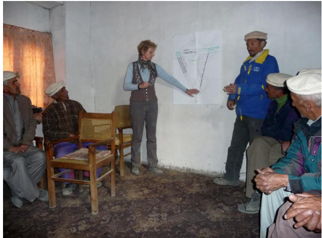
Informationsveranstaltung mit Gemeindevertretern