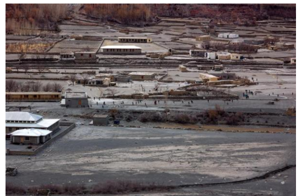
Shimshal beim Landeanflug

Wir konnten am 31.03.10 von Karimabad aus per Helikopter nach Shimshal fliegen und somit die Ausmaße der Katastrophe aus der Luft betrachten. Am Abend durften wir den Vorbereitungen für das Thagham-Fest (Einläuten der Aussaat und des Frühlings) bei unserer Gastfamilie beiwohnen, welches am 01.04. bei Sonnenschein auf einem großen Acker stattfand. Das ganze Dorf trifft sich zum gemeinsamen Essen aus vielen vielen Töpfen in fröhlicher Runde. Wir sind mittlerweile ein Teil der Gemeinde und wurden herzlich integriert und umarmt. Die Freude kommt von Herzen.