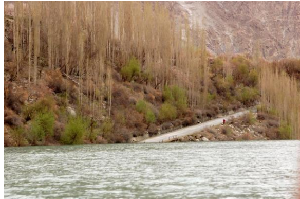
Südl. Flussufer mit Bootsanlegestelle hinter dem Damm Der Karakorum Highway verschwindet im See

Wir konnten am 31.03.10 von Karimabad aus per Helikopter nach Shimshal fliegen und somit die Ausmaße der Katastrophe aus der Luft betrachten. Am Abend durften wir den Vorbereitungen für das Thagham-Fest (Einläuten der Aussaat und des Frühlings) bei unserer Gastfamilie beiwohnen, welches am 01.04. bei Sonnenschein auf einem großen Acker stattfand. Das ganze Dorf trifft sich zum gemeinsamen Essen aus vielen vielen Töpfen in fröhlicher Runde. Wir sind mittlerweile ein Teil der Gemeinde und wurden herzlich integriert und umarmt. Die Freude kommt von Herzen.